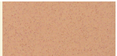
Mandarin 382 Mandarine

A richiesta disponibile anche negli altri smalti Arcadia / Auf Anfrage sind auch die anderen Arcadia Glasuren verfügbar.