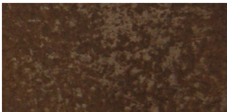
Rocce Brune 601 Brauner Stein

Disponibile a magazzino nei seguenti smalti: / In unserem Magazin lagernd in den folgenden Glasuren: